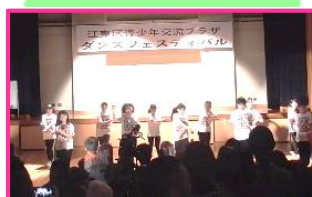
砂町中学校ダンス部

3/24(日)に第1回青少年交流プラザダンスフェスティバルを開催しました！ 10組のダンスグループが出演し、大盛況でした♪